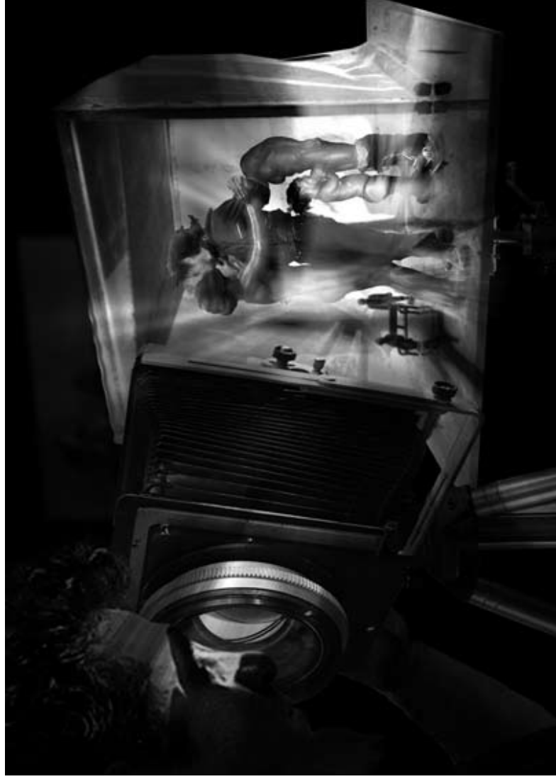
Photomontage - Tirage sur papier barité - 2006 - 70x50 cm - Der Seelensucher