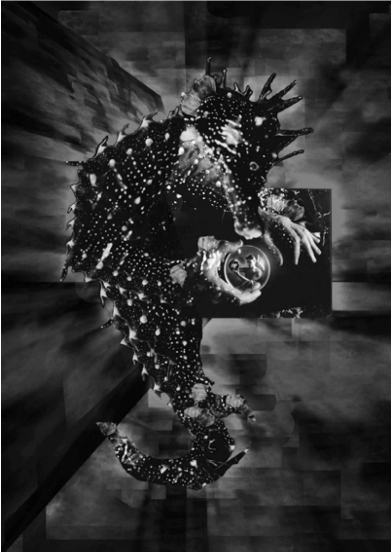
Photomontage - Tirage sur papier barité - 2005 - 70x50 cm Alter Mann