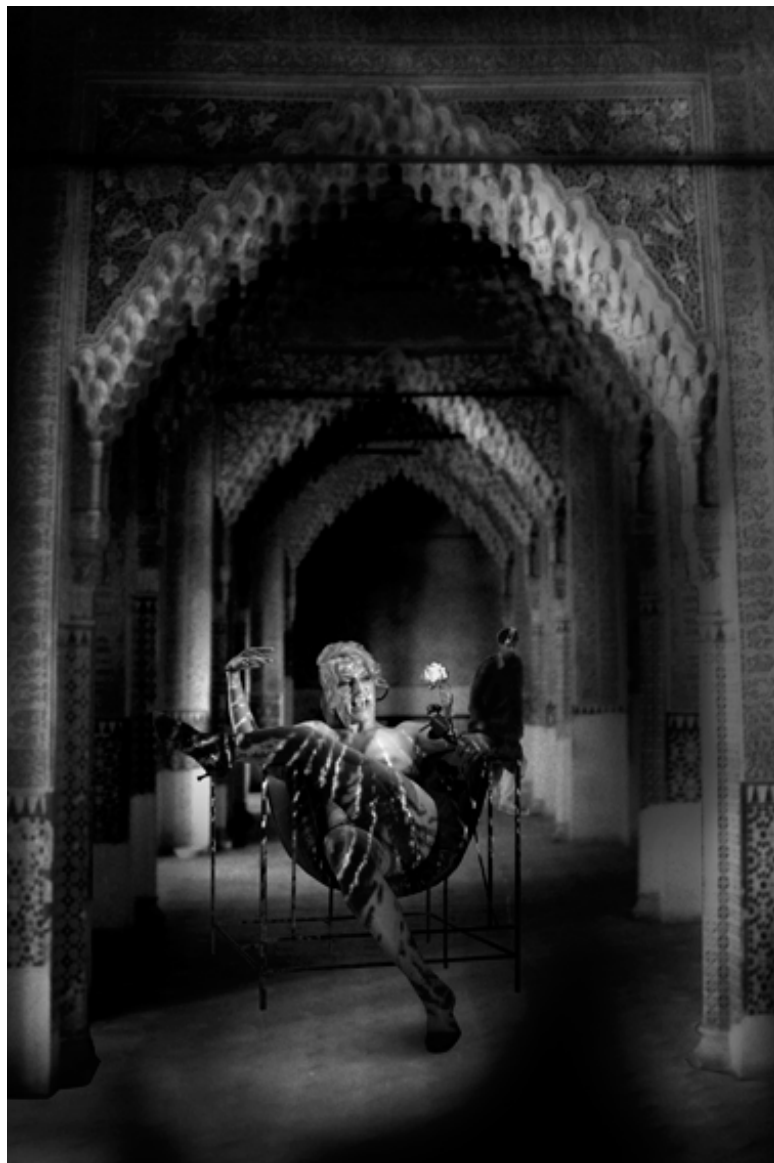
Photomontage -Tirage sur papier barité - 2006 - 70x47 cm - Sultan's Rose