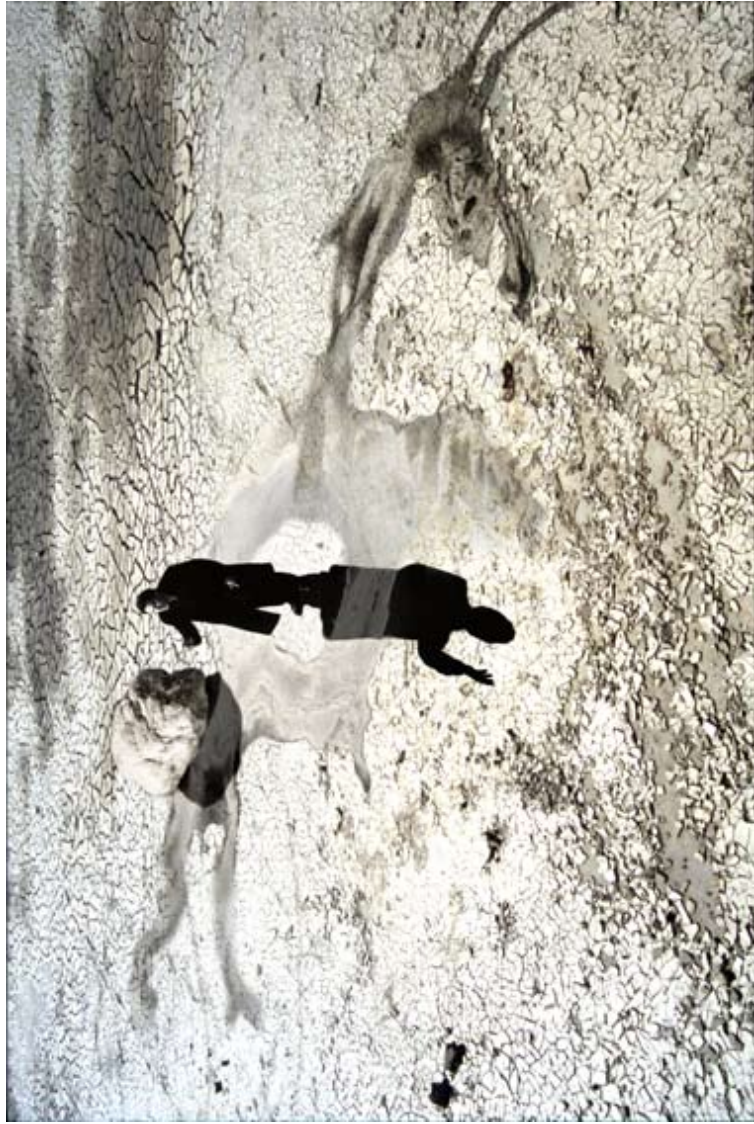
Photomontage - Tirage sur papier barité - 2005 - 70x47 cm - Le Prophète