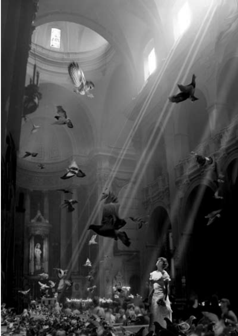
Photomontage -Tirage sur papier barité- 2006- 70x49 cm - Nella Cathedrale