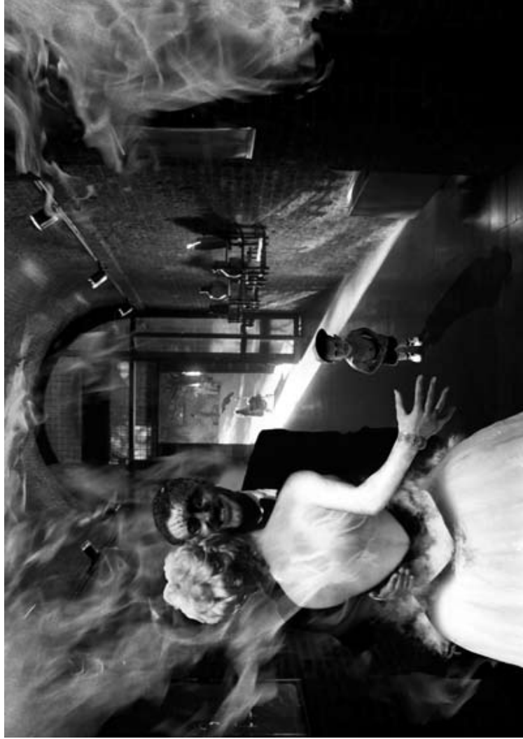
Photomontage - Tirage sur papier barité - 2006 - 70x49 cm - Mama ?