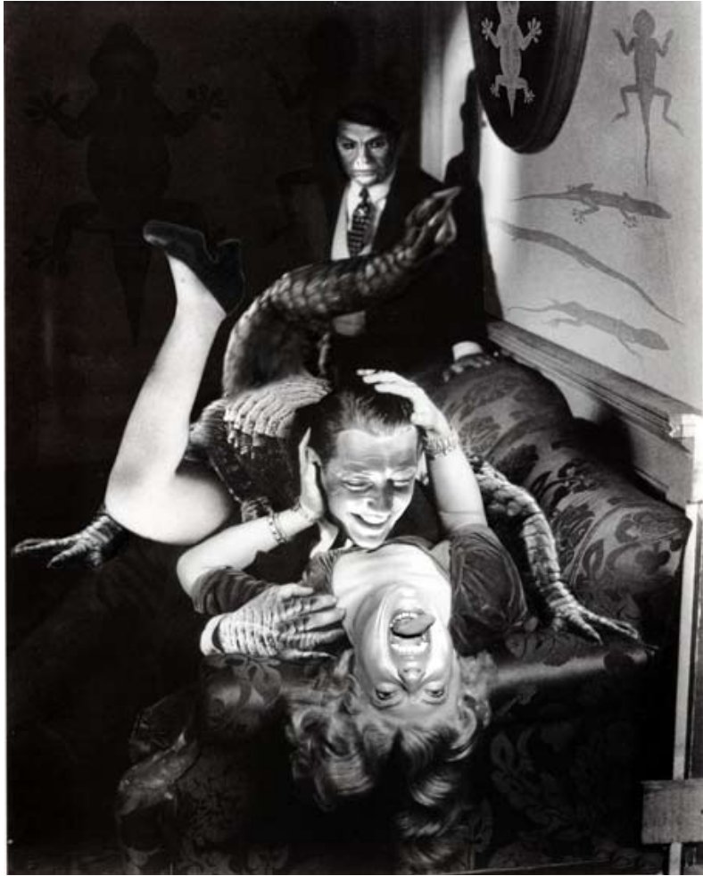
Photomontage - Tirage sur papier barité - 2005 - 70x56 cm - Sur le Divan