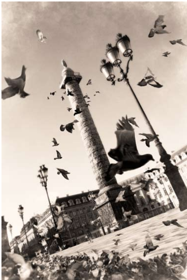
Photomontage - Tirage sur papier barité - 2006 - 70x47 cm - Place Vendôme