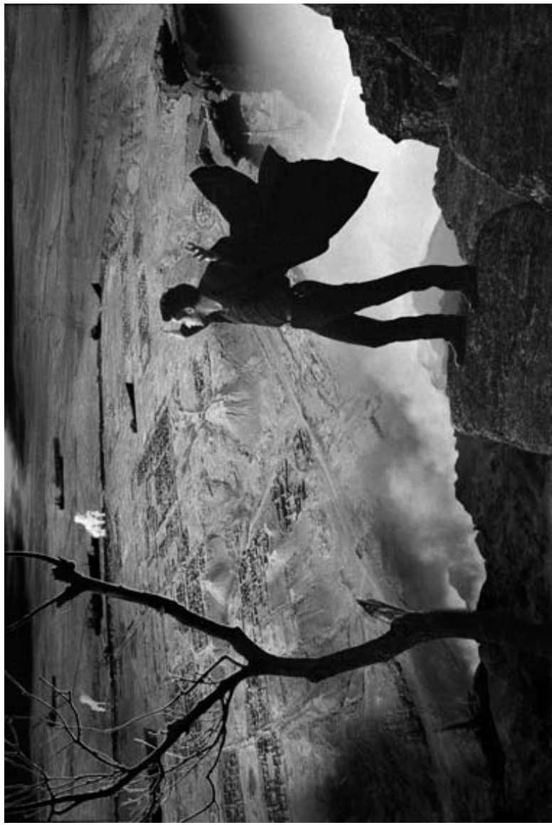
Photomontage - Tirage sur papier barité - 2006 - 70x47 cm - The Kingdom