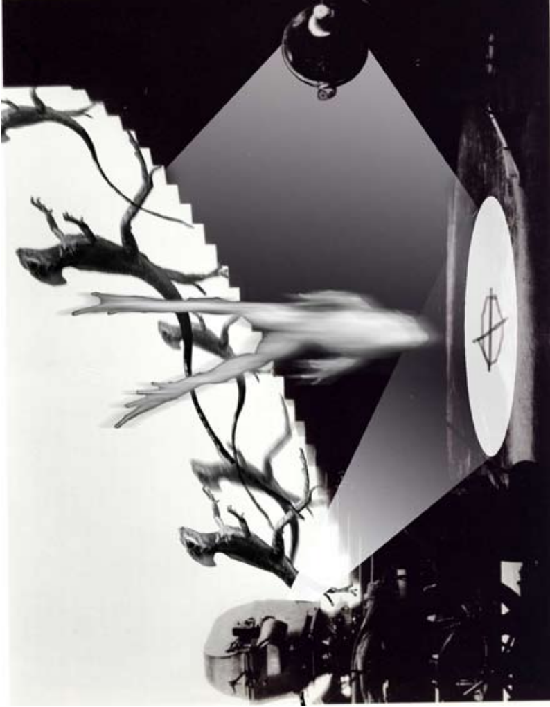
Photomontage - Tirage sur papier barité - 2005 - 54x70 cm - Casting