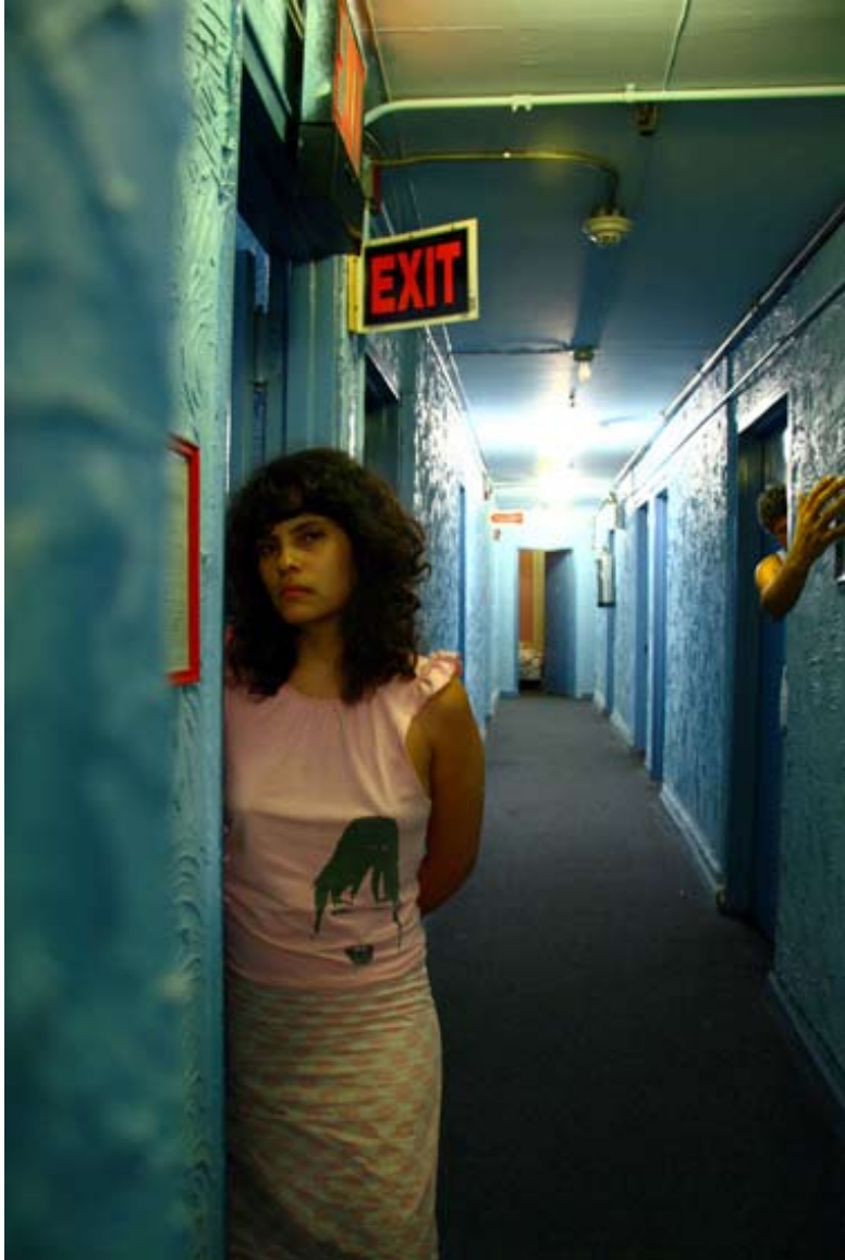
Photomontage - Tirage sur papier barité - 2006 - 70x47 cm - Wong Kar Wei Hotel