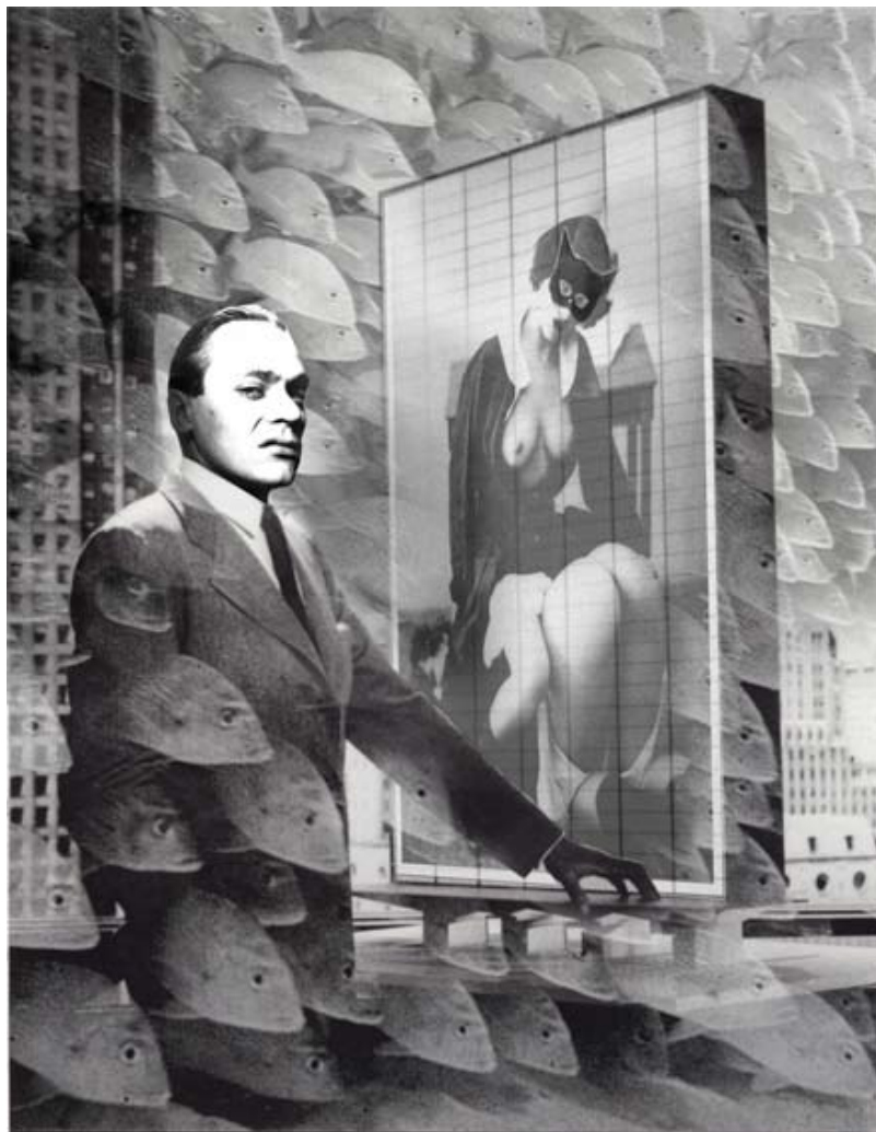
Photomontage - Tirage sur papier barité - 2005 - 54x70 cm - Le Collectionneur